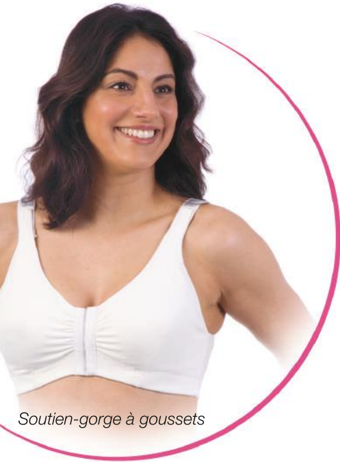
Soutien-gorge à goussets

Soutien-gorges • Gaines • Vestes Compressives • Manchons • Ceintures Bandeaux